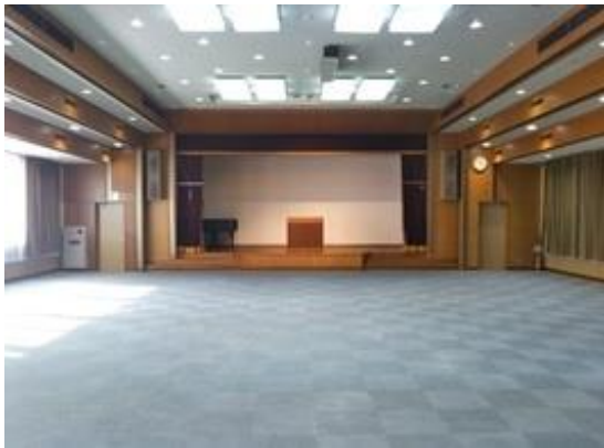
南コミュニティーセンター・多目的ホール