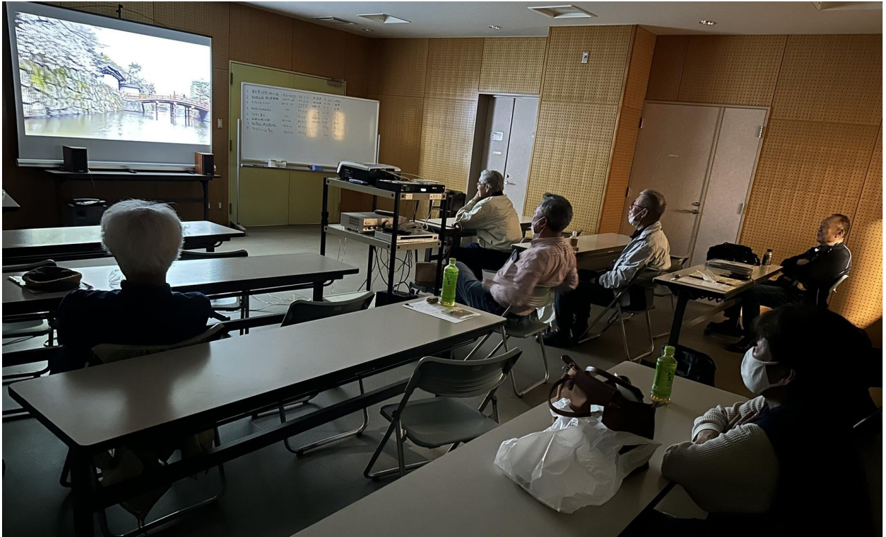
5月度例会 第一部作品発表