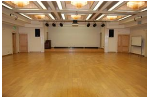
勤労者総合センター・文化ホール