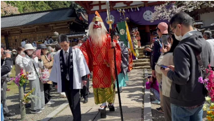
道案内役の猿田比古神