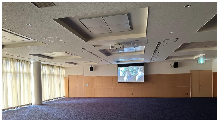
和歌山城ホール・大会議室