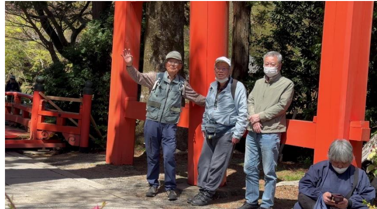
いいカットが撮れたかな

OMC では7月第二例会(7月20日(木)13:30～)で撮影会コンテストを行います。ここで参加者全員で評価を行い、順位を決めます。1位の作品は秋の映像祭で、優先的に放映されるそうです。